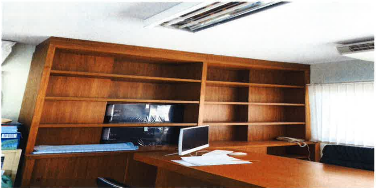
๒๖.โครงการปรับปรุงแผนที่ภาษีและทะเบียนทรัพย์สิน